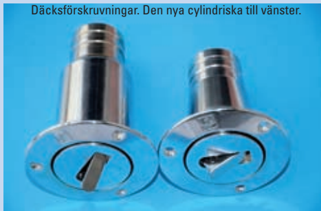
Däcksförskruvningar. Den nya cylindriska till vänster.

modern cylindrisk däcksförskruvning ska vara utförd. Den nya standarden har fördelen att stationens sugmunstycke går att sätta fast i däcksförskruvningen medan man tömmer. Med den gamla standarden måste någon hålla i sugmunstycket under tömning. Den nya förskruvningen passar alla sugstationer (men inte tvärt om). I butikerna finns förskruvningar av båda typerna, flest av gamla typen!